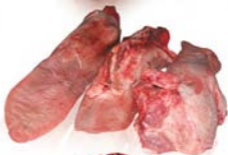
Limbă proaspătă Pork tongue