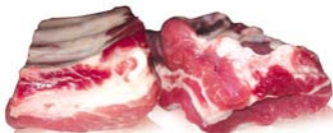
Costiță porc Bone in belly without flank, rind on