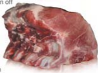
Cotlet cu os Tenderloin bone in