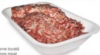
Carne tocată Mince meat