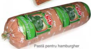
Pastă pentru hamburger Mince meat for hamburger