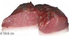
Cotlet fără os Boneless loin chain off