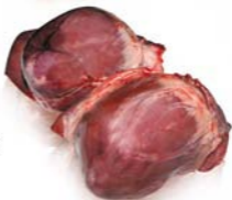
Inimă proaspătă Pork hearts