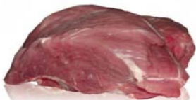
Pulpă porc fără os Boneless ham