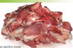
Carne pentru tocat Pork trimmings