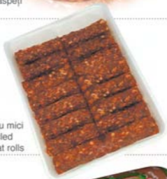
Pastă pentru mici Meat for grilled minced meat rolls