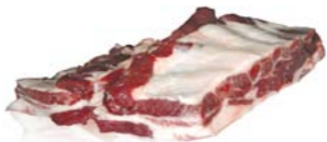
Coaste pentru grătar Ribs for grill