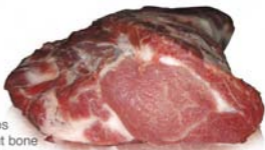
Ceafă fără os Neck without bone