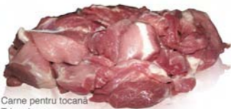
Carne pentru tocană Trimmings