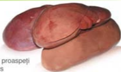
Rinichi proaspeți Kidneys