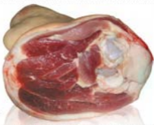
Ciolan proaspăt Pork leg