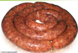
Cârnați proaspeți Sausages